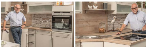
In der Küche geht es darum, Funktionalität mit Geschmack zu verbinden